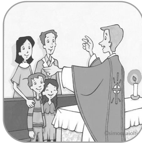
4. Riti di congedo.

Ritaglia e incolla le figure sul lato sinistro interno del cartellone come da immagine