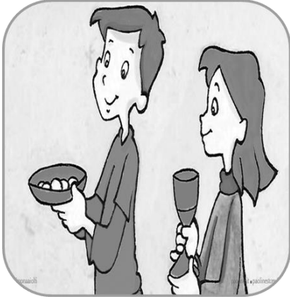
Presentazione dei doni