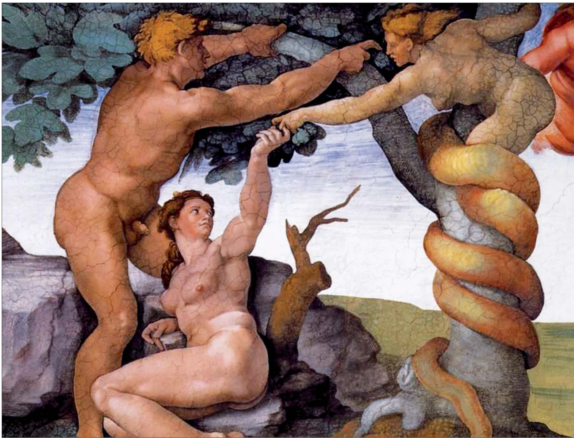
Michelangelo, "Il peccato originale" (particolare). Cappella Sistina, Roma

La famiglia è il soggetto della condizione umana, in un certo senso più di quanto non lo sia l'uomo stesso