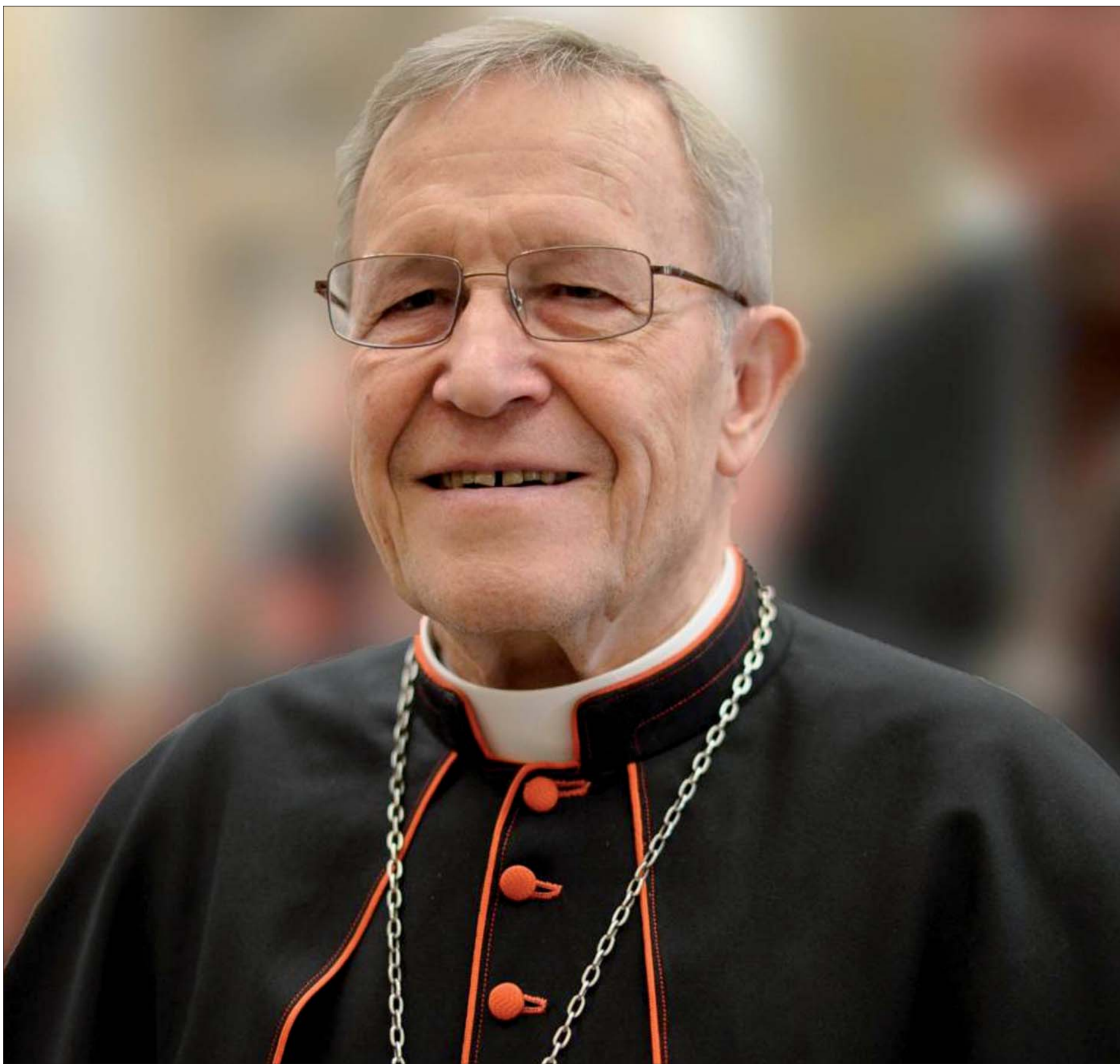
Il cardinale e teologo tedesco Walter Kasper, ha tenuto la relazione introduttiva al Concistoro dedicato alla famiglia

J. Ratzinger ha suggerito di riprendere in modo nuovo la posizione di Basilio. Sembrerebbe essere una soluzione appropriata, che è anche alla base di queste mie riflessioni. Non possiamo fare riferimento all'una o all'altra interpretazione storica, che rimane sempre controversa, e nemmeno replicare semplicemente le soluzioni della Chiesa dei primordi nella nostra situazione, che è completamente diversa. Nella mutata situazione attuale possiamo però riprenderne i concetti di base e cercare di realizzarli al presente, nella maniera che è giusta ed equo alla luce del Vangelo.